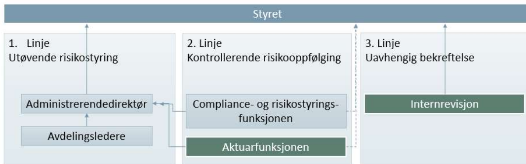
Figur 1: Selskaps- og rapporteringsstruktur

Administrerende direktør (AD) leder selskapet innenfor de til enhver tid gjeldende lover, forskrifter, vedtekter og vedtatte instruksjer på en slik måte at selskapets overlevelsessevne sikres og styrkes, og slik at selskapet utvikles i samsvar med vedtatte planer og strategier. Styret har vedtatt egen instruks for AD.